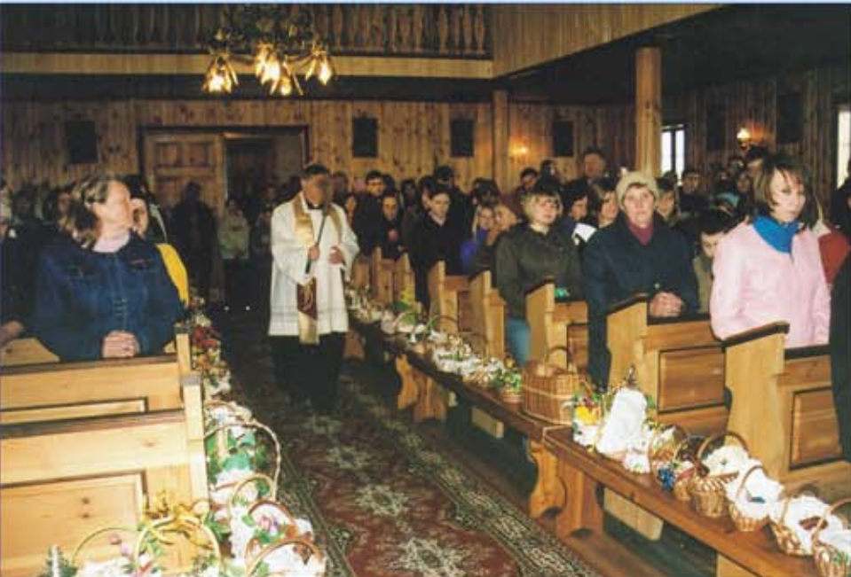
KAPLICA W PŁASKIEJ