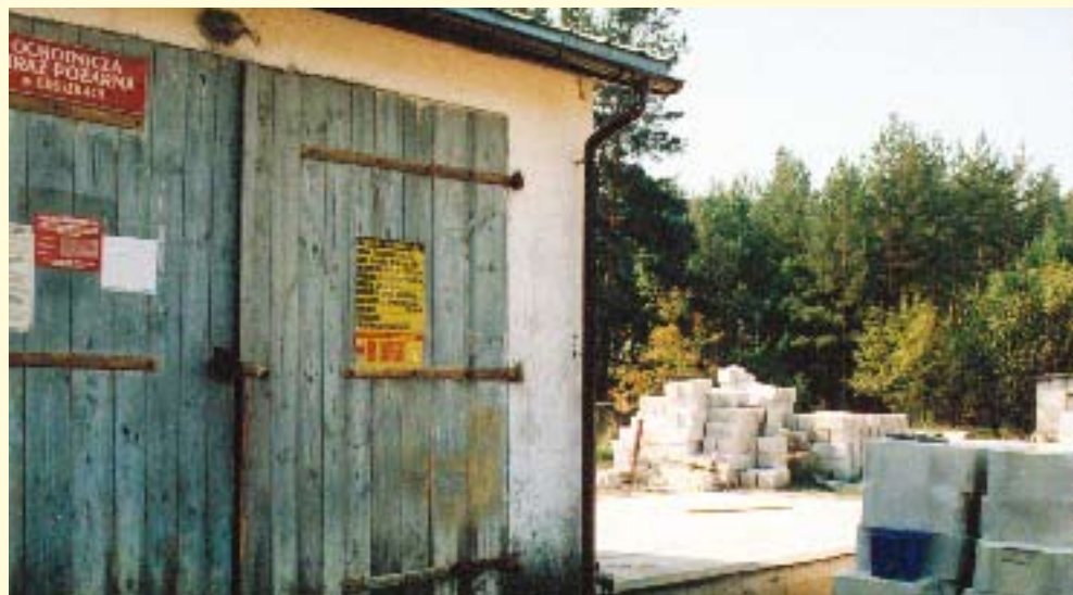
W gruszkach stawiają nowy ocieplany garaż na samochody ratownicze.