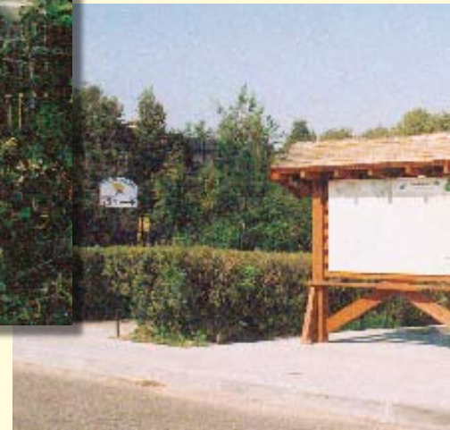
Urząd Gminy z nowym dachem, oknami, pa prezentuje, ale chce się krzyczeć; chodnik, ch