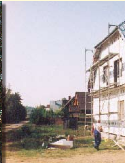
Świetlica w Płaskiej ocieplana i tynk