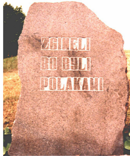
Życia to OFIAROM nie zwróci...

A żeby to się stało, potrzebne są działania polskich władz. Krewni ofiar zbrodni katyńskiej odwołali się od wyroku Europejskiego Trybunału Sprawiedliwości z 16 kwietnia 2012 roku – chcą, by to 17 sędziów Wielkiej Izby Trybunału zbała, czy Rosja rzetelnie prowadziła śledztwo. Ewentualny wyrok Wielkiej Izby strasburyskiego Trybunału w sprawie zbrodni katyńskiej powinien być ostatecznym.