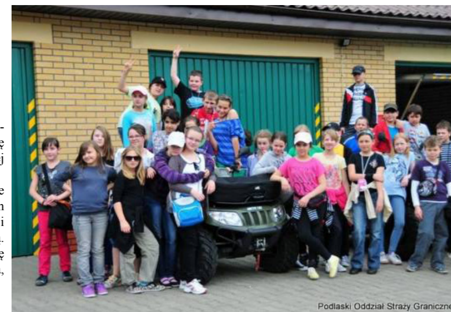
Podlaski Oddział Straży Granicznej