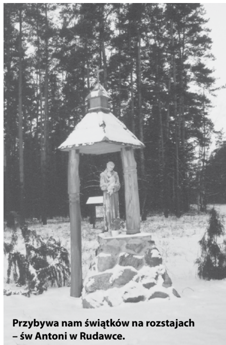
Przybywa nam świątków na rozstajach – św Antoni w Rudawce.

Gratulujemy prymusom i życzymy dalszych sukcesów w zdobywaniu wiedzy i umiejętności.