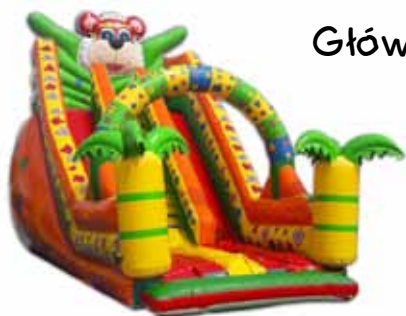
zjeżdżalnia „LEW” o wysokości 9m