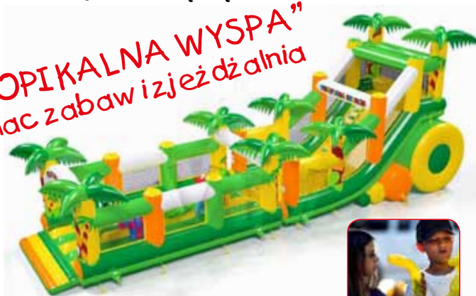
„TROPICALNA WYSPA” - plac zabaw i zjeżdżalnia