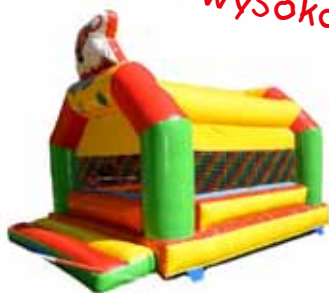
Basen z piłeczkami